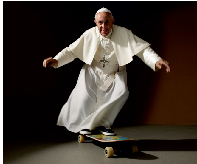
Fotografie, kterou vytvořila umělá inteligence – papež František jede na skateboardu.

Vytvořit dezinformační obsah (text, fotografie, video) je velmi rychlé a snadné. Laické publikum pak uměle vytvořený obsah ve většině případů neodhalí.